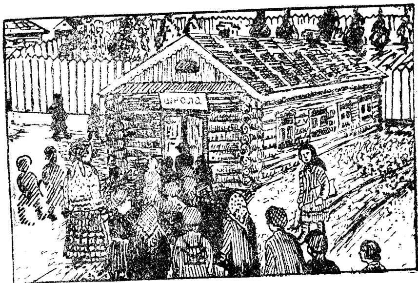
Өкөбнү лікпункт вылё.