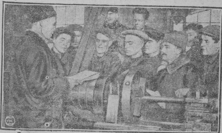
На вагоноремонтном заводе им. „Революции 1905 г.“ вступило в парт 105 ударников. НА СНИМКЕ: Секретарь цеховой ячейки зачитывает список ударников, вступающих в партию для вызова в бюро.