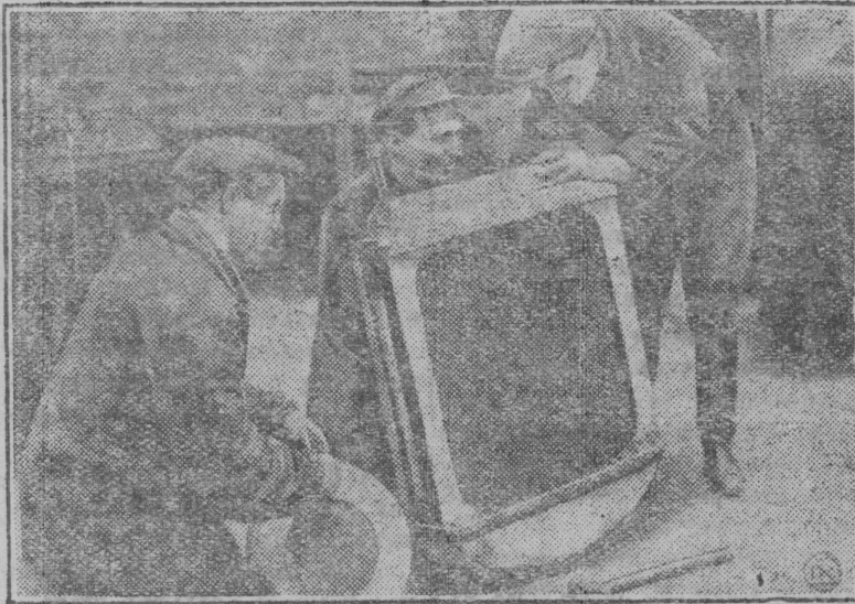
В ремонтно-механическом цехе Тракторостроя в Сталинграде идет подготовка к выпуску первых опытных тракторов. НА СНИМКЕ: Первый собранный радиатор для опытного трактора.