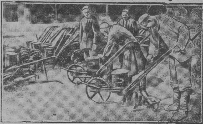
На снимке: Сборка сеялок для посева хлопка.