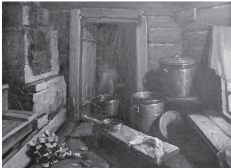
Одзжык баняын веськөтисö быд шөгöт: матегасисö, вомидз чөвтисö.

Некокнит оланын быд-кодь тöдöммез колисö пыр.