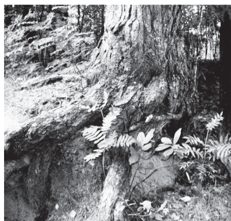
Лесниккез баитöны: «Ольона-пожум кодь пуэз миян вөррезын пантасьлöны öддьөн шоча».

Думайтсö, мый эта йылись кö пондисö тöдны нельки Москваын, то Хазоваын олисез натътö эшö буржыка пондасö радейтны Ольона-пожумысö, и сия вештисьяс нылö бурөн – көр колас сайöвтас кöдыт төвсьян, а көр и пым шондилөн юбөррезьянь аслас вуджөрөн ыркөтас.