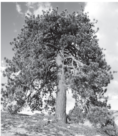
Дерявняын олисез шубны пусö «Ольона-пожумён».

Хазова деревняис пожумыслөн эм ним – Ольона-пожум. Годдэз сьлö – кык сё (200) гөгöр, вылынаис – кык-дас вит метр гөгöр, а кызанас – нель метр кыкдас вит сантиметр. Быдмö сия деревняис дорын. Мый понда быдöс этö сы йылись тöдöмась? Да