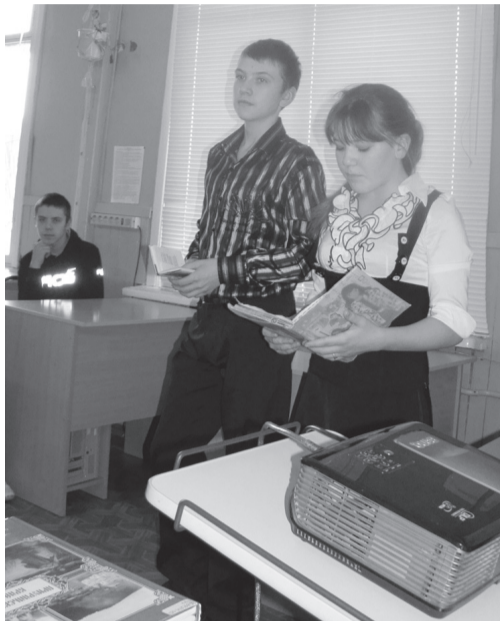
Челядь висьтасьоны гёссезлись кывбуррез

йылись кером памятказз вылын. Эстон колö висьтавыны сы йылись, что Вера Мелехиналөн небөг петис светö годся унажык вотодз ни. Кытонось но коми-пермяцкöй гижиссезлөн