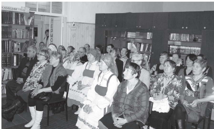
Пантасьöм вылö локтисö ния морттэз, кин понда библиотекаыс лоö мөдöдз гортöн.