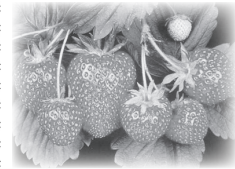
ОЗЪЯГÖД - ЗЕМЛЯНИКА