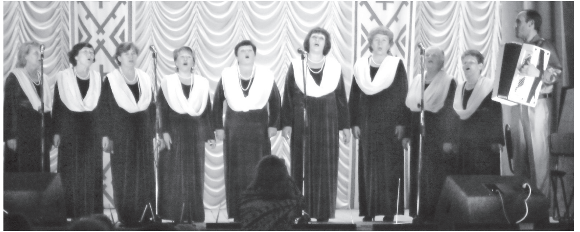
Көч посадись «Напевы» нима сьылан чукөр.

Районнэзлөн чукөррез мыччалисө челядылись да гыриссезлись народной да эстрадной сьылөм, а сідзжө