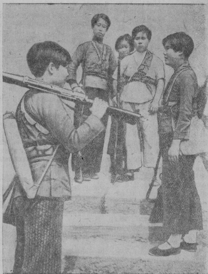
На снимке: Участницы партизанского отряда. Справа на переднем плане—командир отряда.

Партизанские отряды, действующие в тылу у японцев, оказывают активную помощь китайской армии. В числе партизанских отрядов насчитывается большое количество отрядов, состоящих исключительно из женщин.