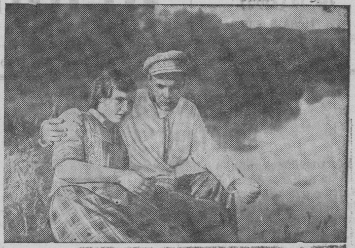
На снимке: Кадр из фильма. Артистка-орденоносец Тамара Макарова в роли Аграфены и заслуженный артист РСФСР, орденоносец В. П. Чирков в роли учителя.

Новый кинофильм „Учитель“ Ленинградской ордена Ленина киностудии „Ленфильм“.