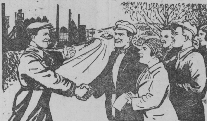
СТРАНЕ МЫ ДАДИМ ТОВАРОВ МАССУ— КОЛХОЗЫ ПОМОГУТ РАБОЧЕМУ КЛАССУ.