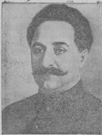
Григорий Константинович Орджоникидзе (1888—1937 г.г.)

Гражданской война фронтэз вылын боевой удж Серго Орджоникидзеб, "чрезвычайной комиссарлоҥо",