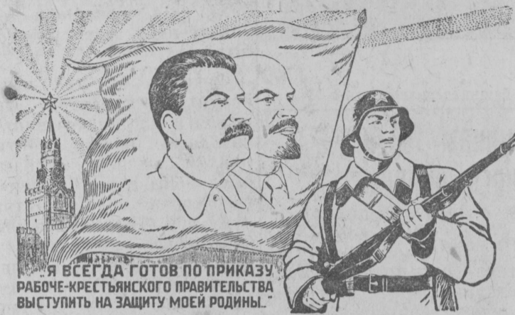
Я ВСЕГДА ГОТОВ ПО ПРИКАЗУ РАБОЧЕ-КРЕСТЬЯНСКОГО ПРАВИТЕЛЬСТВА ВЫСТУПИТЬ НА ЗАЩИТУ МОЕЙ РОДИНЫ.

Ыджытсө и почетнойсь земельной органнэзись работниккезлн задачаэз выставка кешö лөсьөтчөмын. Нийö успешной разрешитөм понда должен пессыны быд земельной работник, животноводство сьбөрт быд специалист.