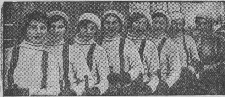
На снимке: команда на катке „Динамо“.

Девушки-физкультурницы команды „Рот-Фронт“ (г. Череповец, Вологодской области) в женском розыгрыше по хоккею заняли первое место.