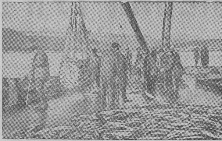
Приемка рыбы от рыбаков колхоза „Красный Труженик“ на речной пристани Озерновского рыбокомбината (Усть-Большерецкий район, Камчатская область).