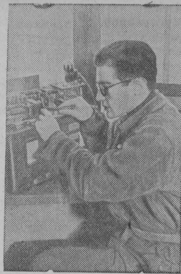
В радио-мастерской кооперативной артели, в городе Барановичи.

В городах западных областей Белоруссии открываются кооперативные артели, объединяющие кустарей.