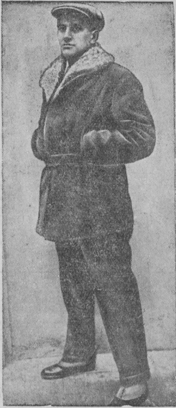
В. В. Маяковский

Маяковский — поэт Октябрьской социалистической революции. Смелый новатор, открывший главу в истории русской поэзии, он совместил в себе высокую сознательность пролетарского революционера, темперамент бойца и большое сердце лирического поэта огромного дарования. Поэт — агитатор, он отдал свой талант трудовому народу, боевым маршем, сатирой, поэмой служил делу партии Ленина — Сталина.