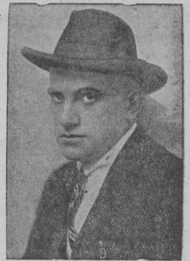
В. В. Маяковский

стомилионнóйбсь сувтам быдсóн. Петас пехотаным бойó вились, мусó зэгалóмись немóн он видз. Ассис присяга Некин оз вунóт, лава Буденнóйлóн сетас бур од. Керас буржуй виль блокадаэз кóр, лоас гóрд кайезлóн сэк быд кымóр. Одзланься бойезын слава судзóт, тэ, большевиккэзлóн! армия Гóрд! Вуджóтис Н. Попов.