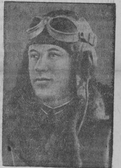
Герой Советского Союза батальонный комиссар Александр Николаевич Костылев.

Ёрт Устюжанцевлөн бригадын 27 морт, ния лэдзисö ваб 11000 фестметра древесина. Устюжанцевлөн бригада лунсыя норма тыртö 200—250 процент вылö. В. Борисов.