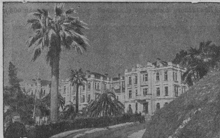
Санаторий имени Ленина в Гульрипше (Абхазская АССР).