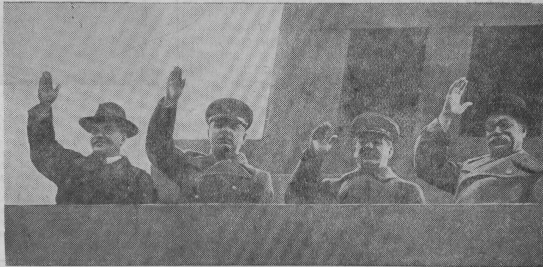
Справа налево—товарищи Ярославский, Сталин, Ворошилов и Молотов на трибуне мавзолея.

ПРАЗДНОВАНИЕ 1 МАЯ В МОСКВЕ Демонстрация трудящихся на Красной площади.