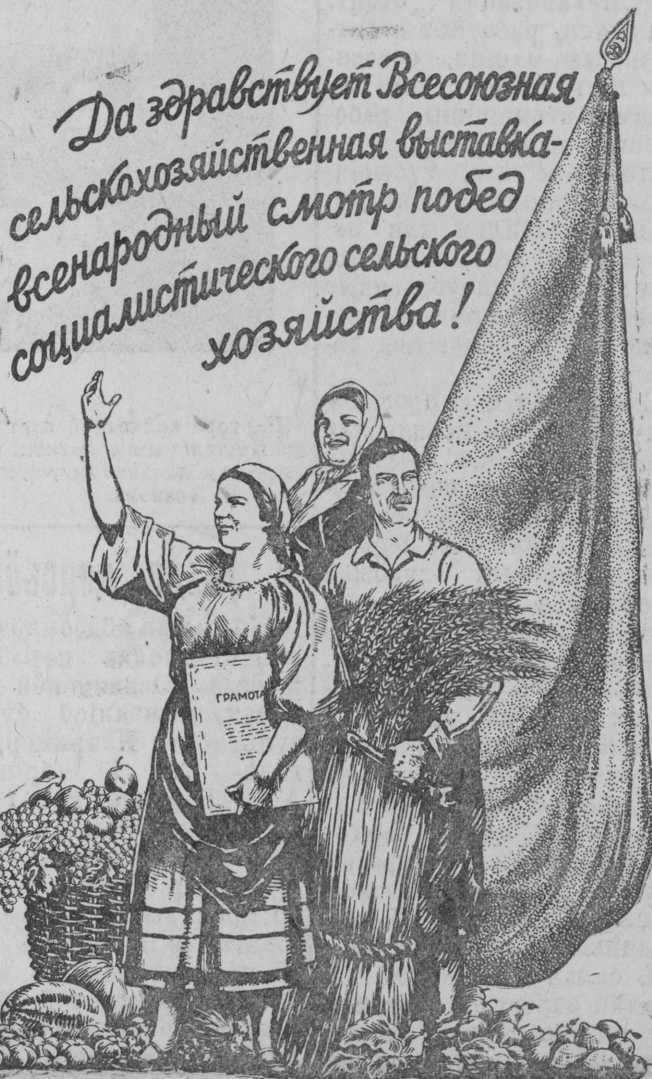
Рис. В. Баркова и В. Лисевича.

1940 годся Всесоюзнйй выставка вылын участниккэзлб да экскурсанттэзлб пым привет!