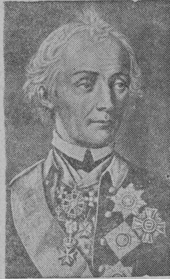
А. В. Суворов (1730—1800).

рез неисправностьсян сущалонны. Радостев да Лунегов буржыка уджалом туйо, часто пируйтлоны, кыз, например, май 15 лунд кыкванные влісо кодсь. МТС договор съорті тракторрез долженоо влісо выработайтны Рочевской колхозын тулыся горюм съорті 30 га, зябь культивируйтны 20 га, пинявы 20 га, яровой посев 20 га, но талуны лун кежо Рочевской колхозло эшо эз горю немьмда, тракторрез се эшо ондз уджалонны Ошибской колхозын. М.