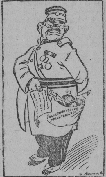
Генерал Абэ: — Вот вам мои верительные грамоты... Рисунок Г. Вальк. Фото-клише ТАСС.

Генерал Абэ назначен японским послом при „правительстве“, Ван-Цзин-Вея.