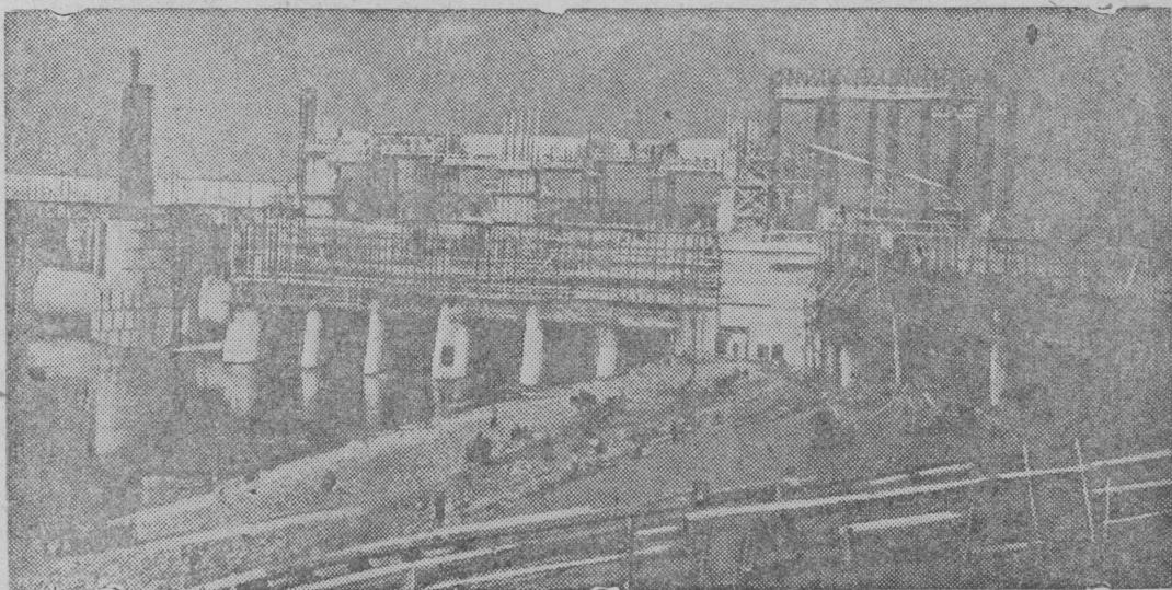
На строительстве гидро-электростанции Угличского гидроузла

В колхозном клубе раздела „Новое в деревне“ президиум Московской коллегии адвокатов организовал постоянную юридическую консультацию по гражданским, уголовным, земельным, налоговым и жилищным делам. Консультации даются экскурсантам бесплатно ежедневно от 12 до 18 часов.