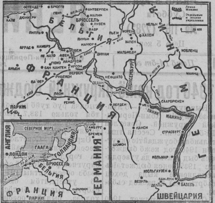
К военным операциям в Западной Европе.