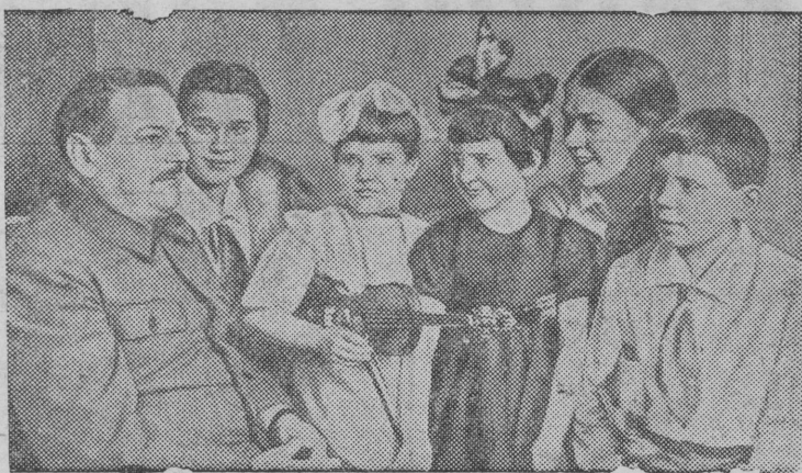
В Ленинграде закончился общегородской смотр детского художественного творчества. На заключительном концерте присутствовал А. А. Жданов. Тов. А. А. Жданов среди участников концерта.