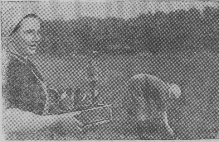
Высадка рассады капусты в колхозе „Пионер“.

Колхозники сельхозартеля „Пионер“ (Кунцевский район, Московской области), широко внедряют у себя в колхозе опыт передовиков сельского хозяйства, показанный на ВСХВ.