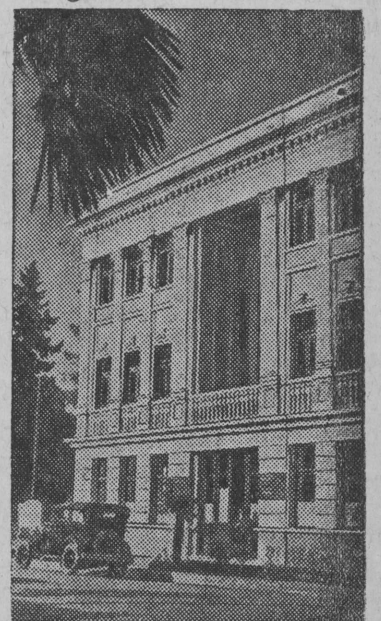
Новое здание дома печати на улице Коминтерна в Батуми (Аджарская АССР), выстроенное в конце 1939 года.