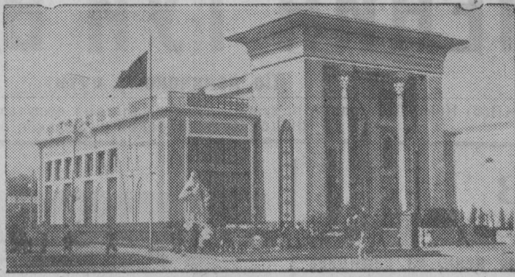
Павильон Азербайджанской ССР.

Всесоюзная сельскохозяйственная выставка.