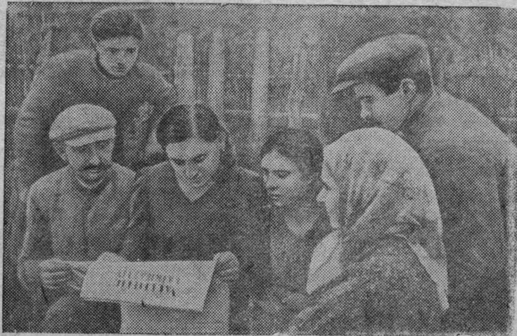
Крестьяне деревни Кармелово (Пет.ашунской волости, Каунасского уезда) читают газету на родном литовском языке.