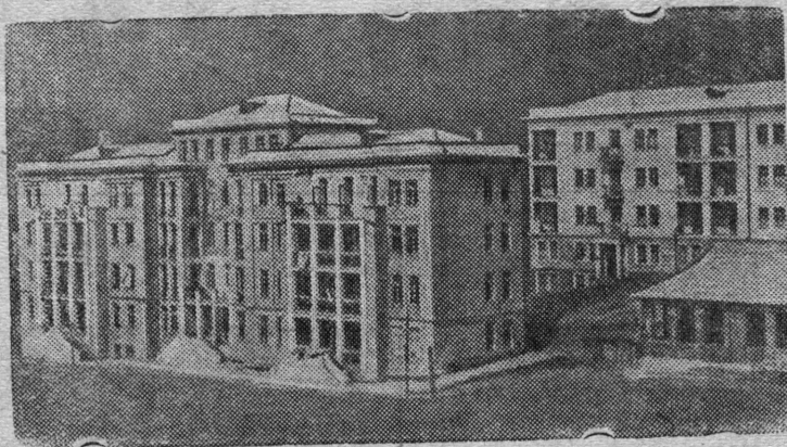
Строящиеся новые жилые дома в новом рабочем поселке „Жан- туха“.

Тварчельский каменноугольный рудник имени Сталина (Очем- чирский район, Абхазская АССР).