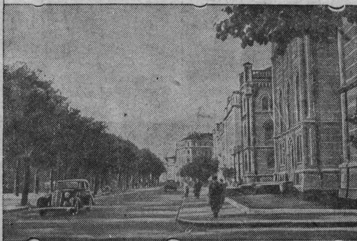
Улица поэта Райниса в г. Риге.