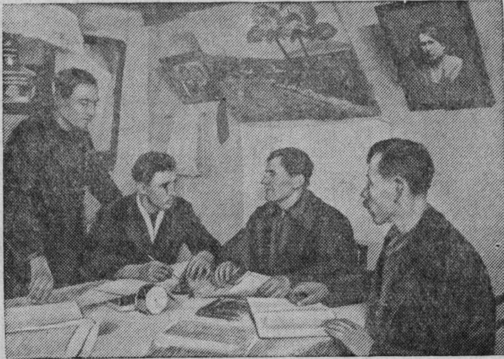
Правление колхоза обсуждает план работы.

Крестьяне деревни Комаровка Нарвской волости организовали колхоз „Красная Комаровка“. Это один из первых колхозов в Советской Эстонии.