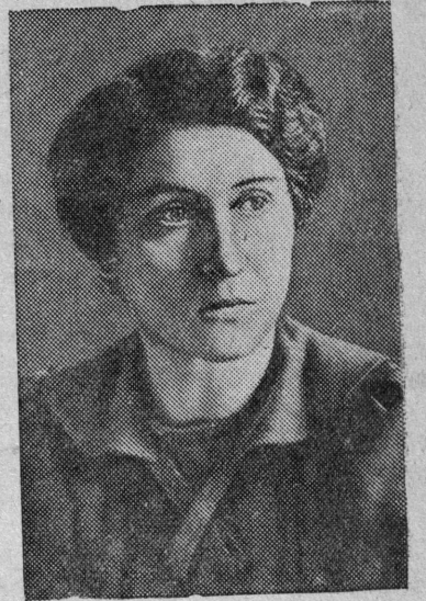
Выдающаяся советская писательница, автор замечательных книг о жизни и борьбе польского народа, депутат Верховного Совета СССР Ванда Васильевская.