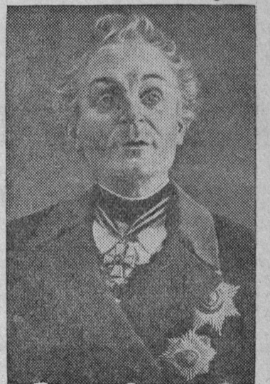
Бюст А. В. Суворова—работы художника-мультилиста Ф. М. Соколова.

24 ноября исполняется 210 лет со дня рождения великого русского полководца А. В. Суворова.