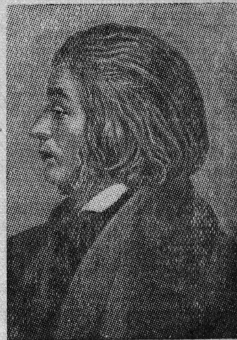
Адам Мицкевич.

26 ноября исполняется 85 лет со дня смерти великого польского поэта Адама Мицкевича.