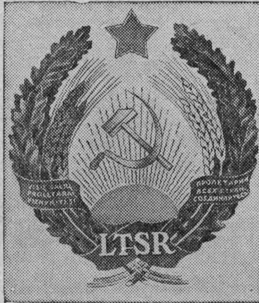
Государственный герб Литовской ССР.