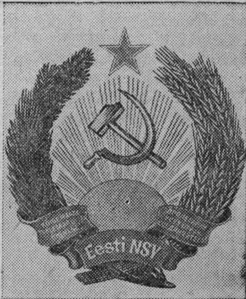
Государственный герб Эстонской ССР.