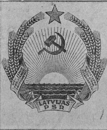
Государственный герб Латвийской ССР.