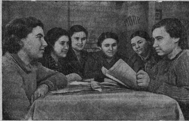
Заседание оргкомитета РОКК при 1-й государственной табачной фабрике в Кишиневе.

На предприятиях и в учреждениях г. Кишинева организованы и приступили к работе первичные организации Общества Красного Креста (РОКК).