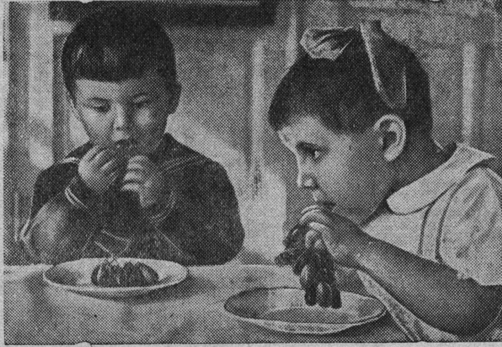
В детских яслях Кузнецкого металлургического комбината имени Сталина (гор. Сталинск).