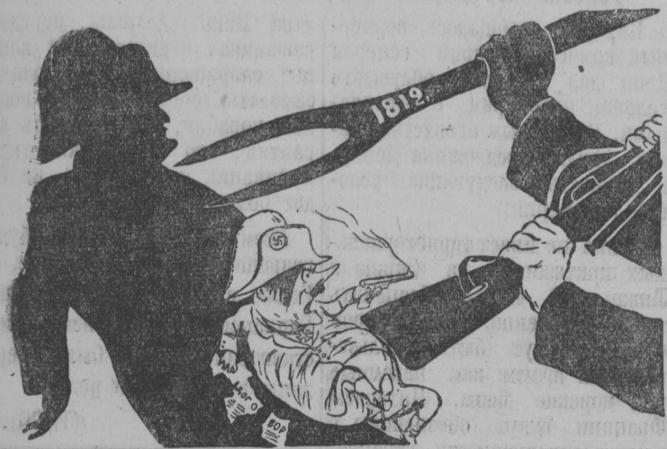
Наполеон потерпел поражение, то же будет с зазнавшимся Гитлером!