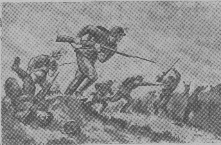
Грозна атака штыковая! Бегут фашистские войска: