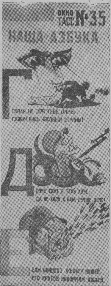
Рисунки художников Н. Радлова, П. Шухмина и А. Радакова. Репродукция Г. Широкова. (Фото ТАСС)