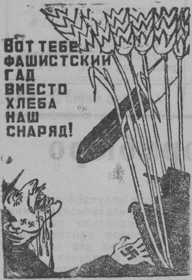
Плакат работы художника М. Китизарьяна.