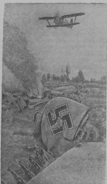
Славный советский сокол парит над сбитым им фашистским стервятником.