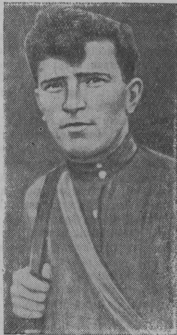
Сельская интеллигенция — активный участник партизанского движения.