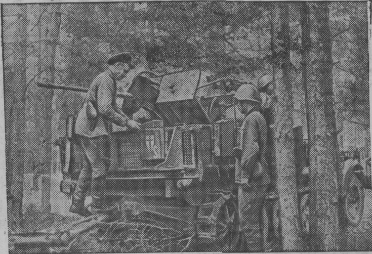
Одна из захваченных автоматических самоходных пушек противника.

В боях под местечком Б. нашими частями был захвачен в плен и частично уничтожен в бою разведывательный отряд фашистских войск. Захвачено много ценных документов, оружия, боеприпасов и пленных.