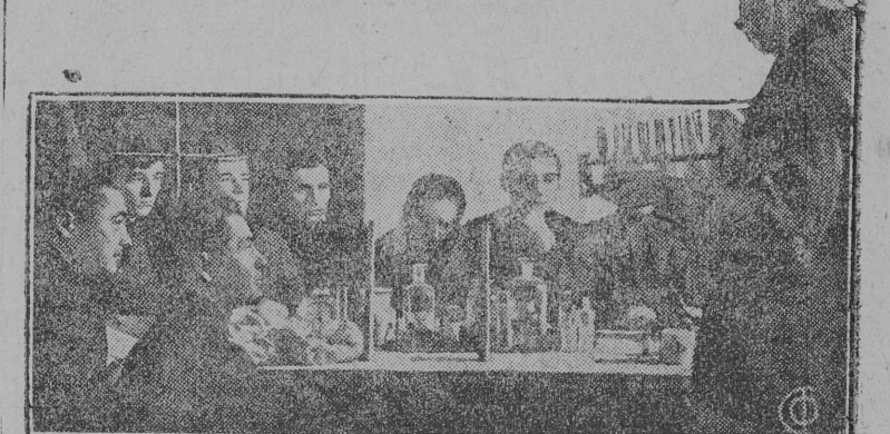
На снимке: 35 Бригадиров на учебе

Возглавим колхозные бригады крепкими бригад. рами По постановлению ЦК партии важнейшим в организации труда в колхозах должна стать бригада. Главнейшей обязанностью правлений всех колхозов сейчас является подбор бригад из состава лучших колхозников, подготовка их. Выполняя решение ЦК, Прилуцкий райколхозсоюз организовал курсы бригадиров колхозов и совхозов.