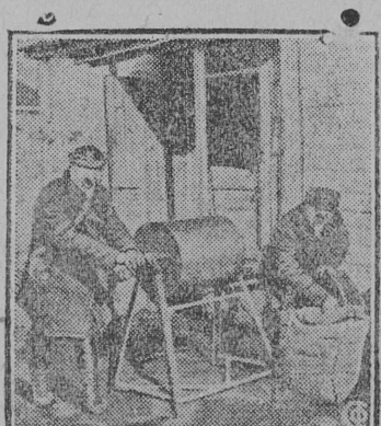
На снимке: Протравка семян в колхозе им. 13 й годовщины Октября (Кантемировский р н)