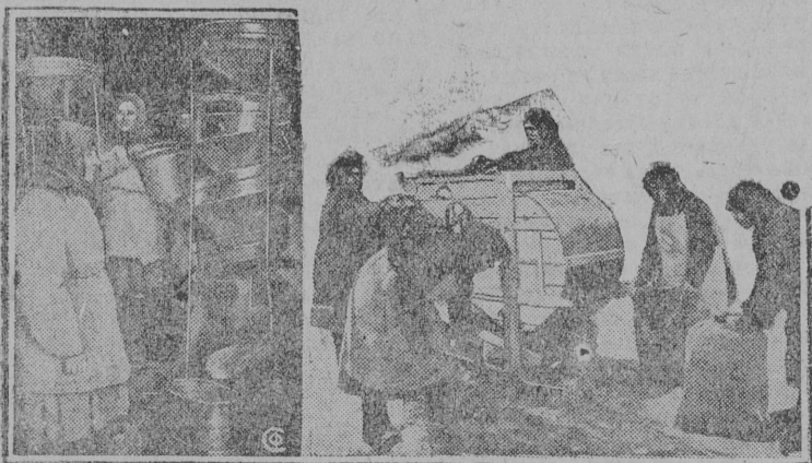
НА СНИМКЕ: Слева очистка семян на машине "Змейка", Прилукском отделении Союзхлеба (УССР). Справа сортировка семян в Домодедовском колхозе, Подольского р-на Моск. обл.