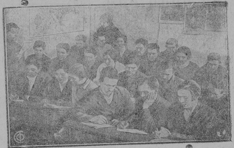
Курсы бригадиров коммуны "Победа" в районном центре