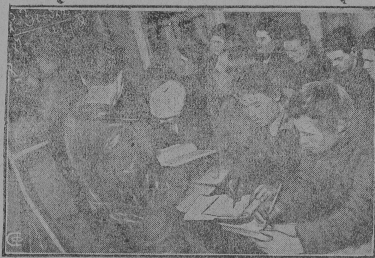
На снимке: На уроке-математики в вечернем рабфаке в Самарском зерно-совхозе (Средняя волга)