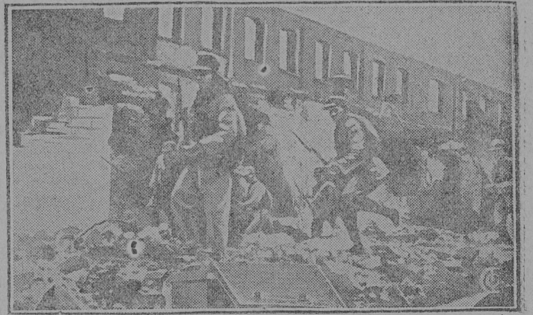
На снимке: Бой в Чапее. Китайские солдаты идут контрнаступление.

Опасность для дела мира за время „работ“ конференции не только не уменьшилась, но неизмеримо возросла. Поджигатели войны во всех странах лихорадочно работают над тем, чтобы разжечь новую мировую войну и в первую очередь войну против Советского Союза.