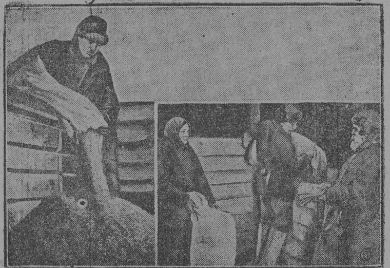
На снимке: 1. Колхозник засыпает семязерно в зернохранилище колхоза «Труженик». 2. Колхозники в порядке займа сдают свои излишки овса в колхозный амбар.