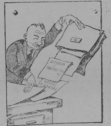
„Ударник“ подготовки к сплаву