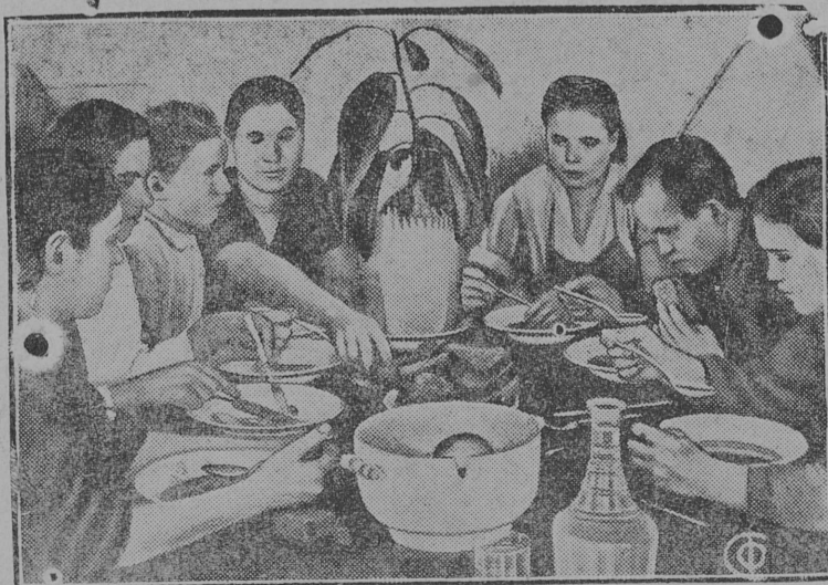
Столовая коммуны „Правда“, Борисоглебск. р на, ЦЧО Коммунары обедают