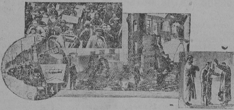
На снимке: Вверху бегство китайского населения из Челея в ожидании наступления японских войск. Внизу—Японские броневички на улицах Ханькоу справа—Обыск китайца японским солдатам на улице. В—центре—дома в Шанхае, разрушенные в результате обстрела их японскими войсками.