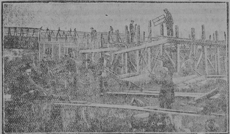
На снимке: Коммунары за стройкой жилых домов.