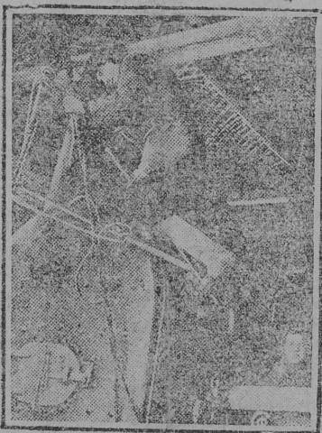
На снимке: Установка локомотива в 43 лошадиных сил в паросиловом хозяйстве.

В Мьяксе /Ленинградская область/ пущен в ход большой механизированный завод. Производительность завода 3,5 тонн тресты в смену.