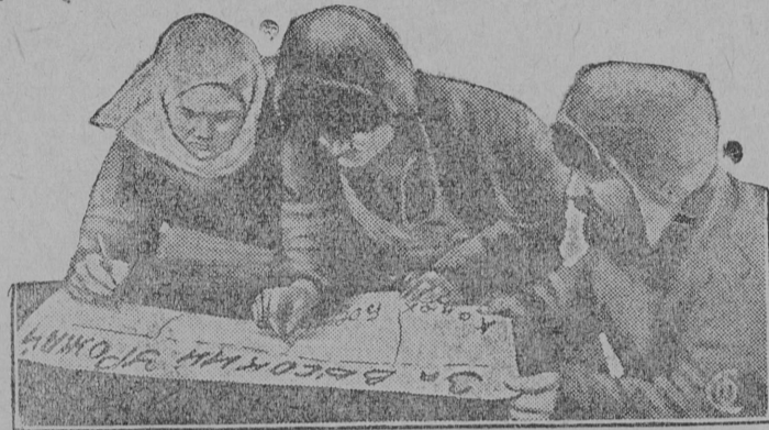
На снимке: Редколлегия за работой