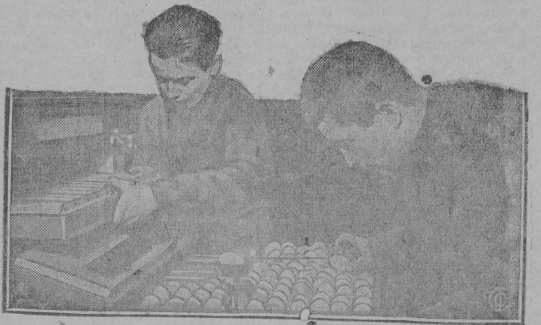
На снимке: Закладка яиц в инкубатор.