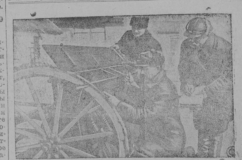
Бригадир 4-й бригады колхоза „Денинской Шлях“ (Парятанский р-н. УССР) принимает прикрепленную к его бригаде сеялку.