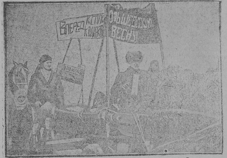
Агитповозка колхоза «Красный кунач» Ливенского р-на ЦЧО со стенгазетой, литературой и плакатами.